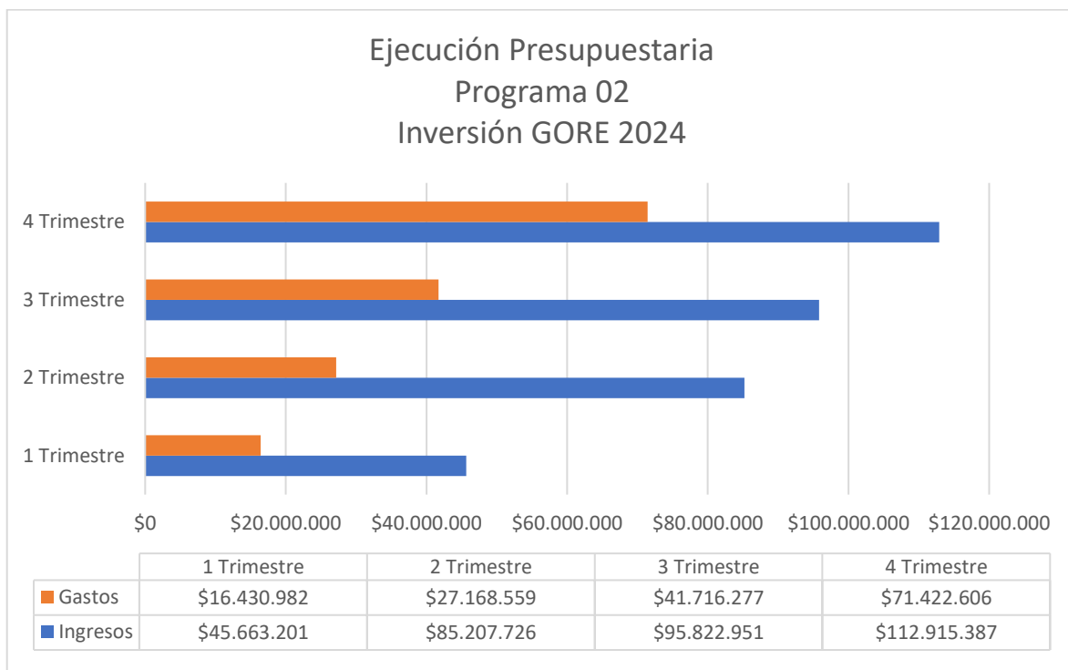
Gráfico 3 : Contiene montos devengados y comprometidos del programa 02 de inversión del Gobierno Regional de Antofagasta. Elaboración Propia.