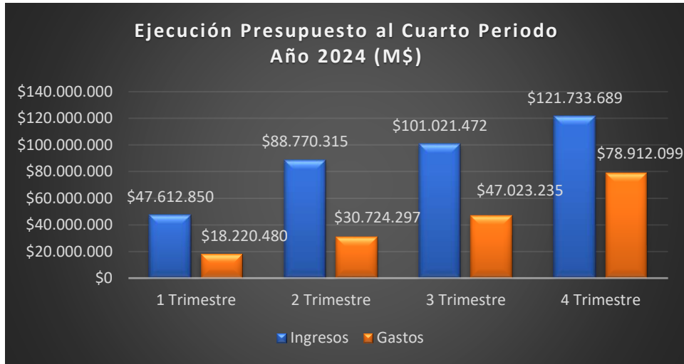
Gráfico 1: Contiene los montos totales de ingresos y gastos de programas 01 y 02.